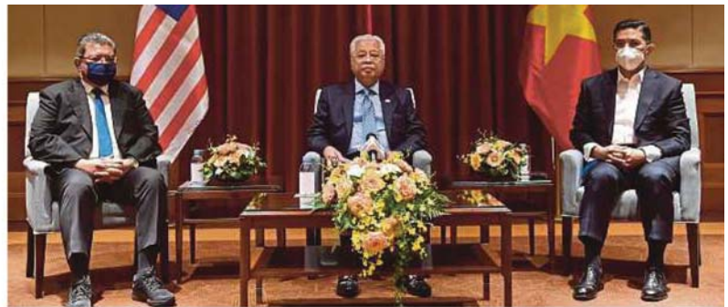
Ismail Sabri bersama Mohamed Azmin dan Menteri Luar, Datuk Seri Saifuddin Abdullah pada sidang media bersama wartawan Malaysia pada hari terakhir lawatan rasminya ke Vietnam, semalam.

Ismail Sabri berkata, bagi memperingati ulang tahun itu, beliau turut mencadangkan pertukaran lawatan peringkat tertinggi negara, yang akan dimulai lawatan negara Presiden Vietnam, Nguyen Xuan Phuc ke Malaysia dalam tahun ini.